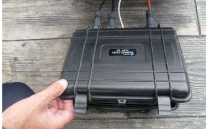
2 RETIRER LE BOITIER

et l'ouvrir afin d'accéder à la batterie