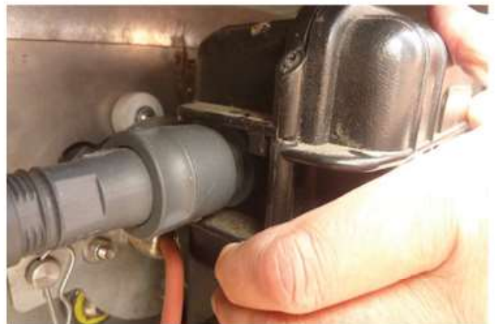
6 REMETTRE LE BOITIER

en faisant attention a placer celui ci sur les encoches