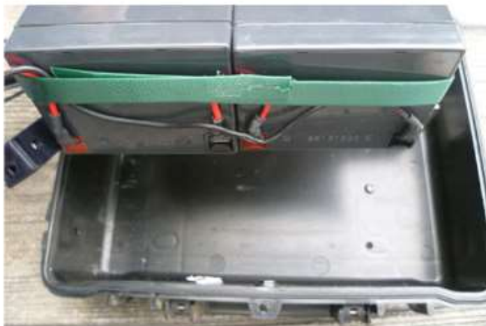
5 Assurer vous que les cosses soient du côté plastique du boîtier.