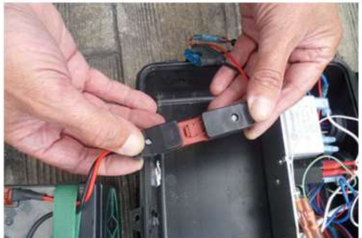
4 BRANCHER LES CONNECTEURS

débrancher le connecteur et remplacer votre batterie.