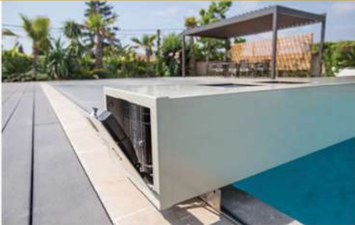
1 OUVRIR LA TRAPPE